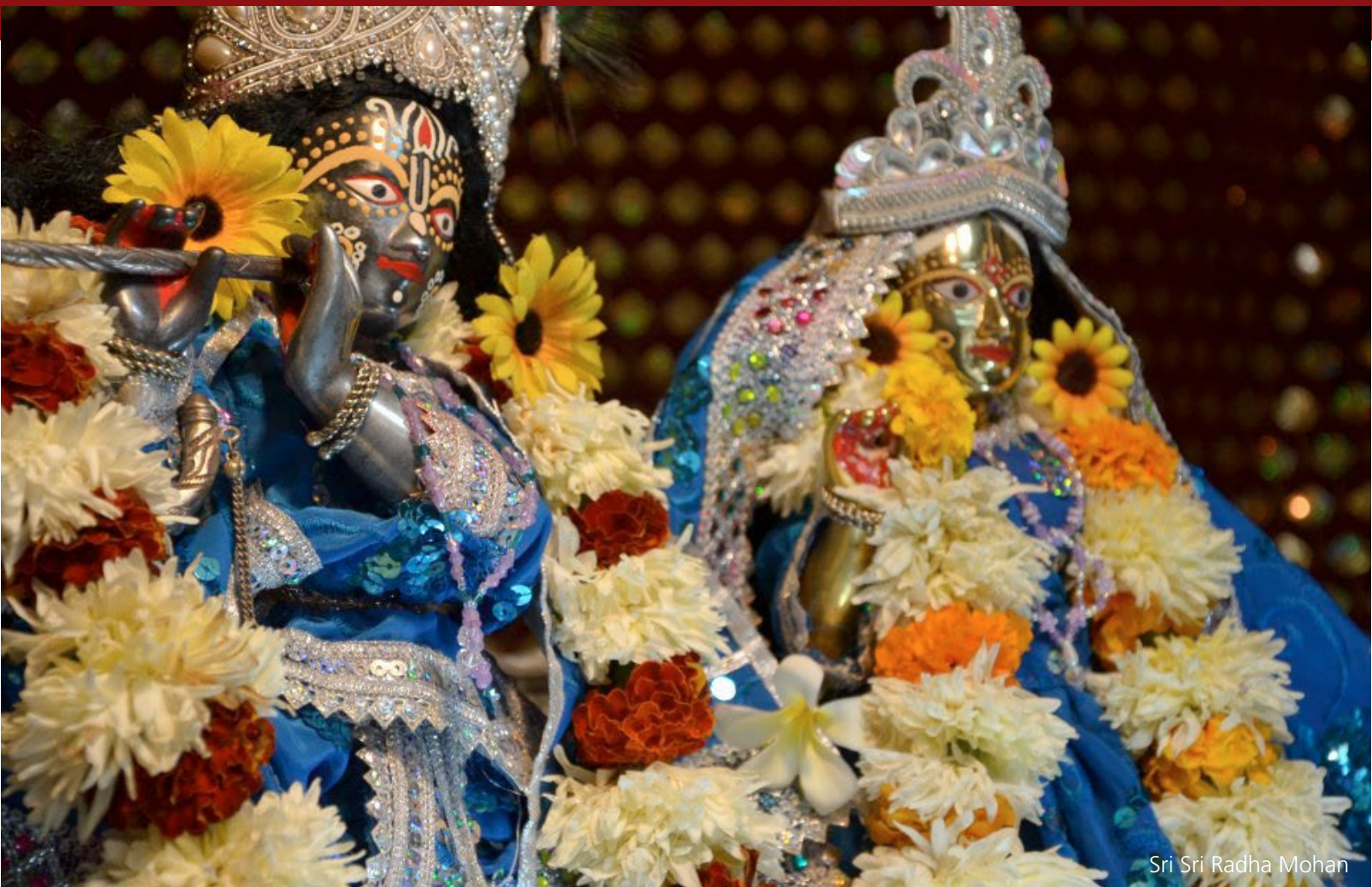
Sri Sri Radha Mohan